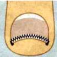
巻き爪マイスター®